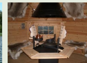
Kota grill (jusqu'à 8 personnes)

contact : tourisme@domaine-de-mazerolles.fr