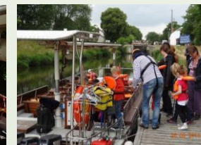
L'Éducation à l'Environnement