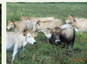
La Vache Nantaise

BALADES DECOUVERTES : à partir de La plaine de la Poupinière, l'écluse de Quihiex (1h00) 8 € La Plaine de Mazerolles, Sucé sur Erdre (2h00) 12 € Promenade commentée sur la rivière, sa faune, sa flore.